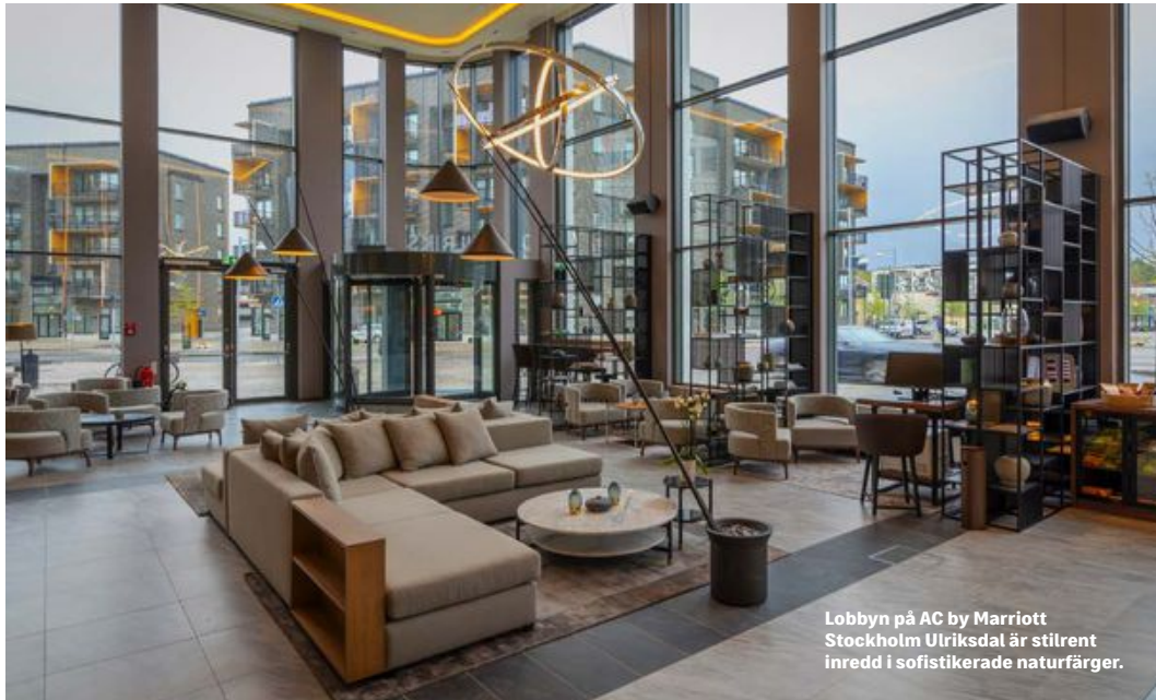
Lobbyn på AC by Marriott Stockholm Ulriksdal är stilrent inredd i sofistikerade naturfärger.