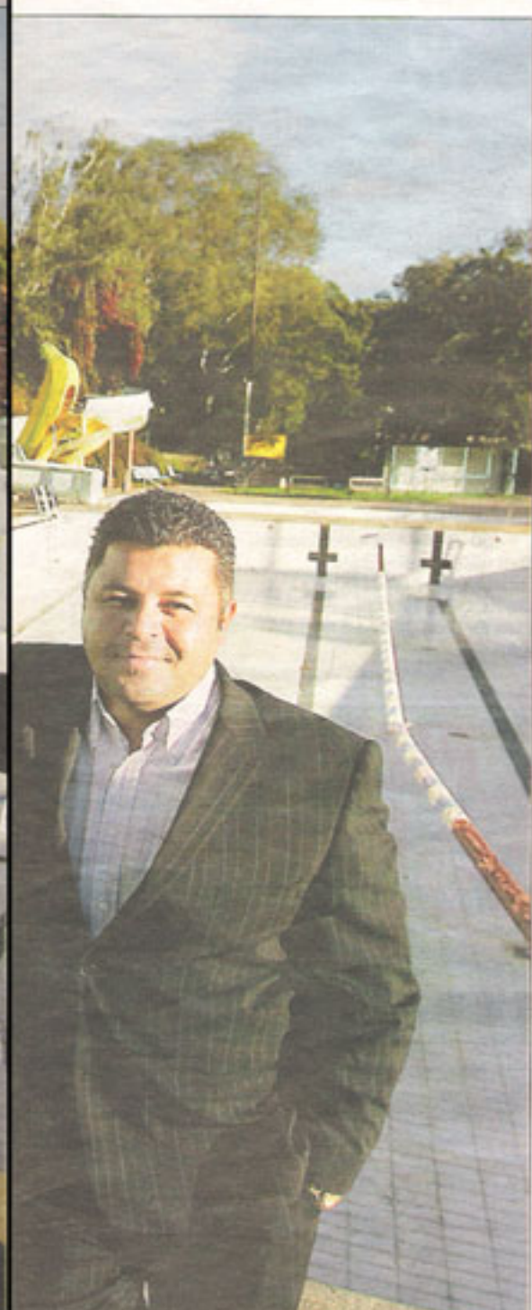
han är häkt" säger han

ta med huvudkontor i Stockholm hade invandrarbakgrund år 2003. Inget av bolagen hade en vd som var invandrare och i 32 bolag fanns ingen invandrare alls. Antal anställda i invandrarföretag: 0 anställda: 67 procent 1-5 anställda: 17 procent Fler än fem anställda: 16 procent